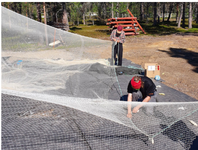
Hankkeen nuottaajat korjaavat kylän nuotta Metsähallituksen kiinteistön pihalla Sevettijärvellä.

Metsähallitus oli niin ikään yhteistyötahona hankkeen toteuttamisessa ja luovutti hankkeen käyttöön Metsähallituksen Sevettijärven alueella aiemmin toteuttamassa hoitonuottauksessa kerättyjen nuotta-apajien tiedot ja kartat. Lisäksi kesällä 2020 hankkeeseen palkatut nuottaajat toteuttivat nuotan korjauksen Metsähallituksen kiinteistön alueella Sevettijärvellä. Syksyllä 2021 Metsähallitus myös lainasi veneen ja moottorin hankkeen käyttöön, lopulta kuitenkin peruuntunutta nuottausta varten. Yhteistyö myös Metsähallituksen kanssa toimi hyvin läpi koko hankkeen.