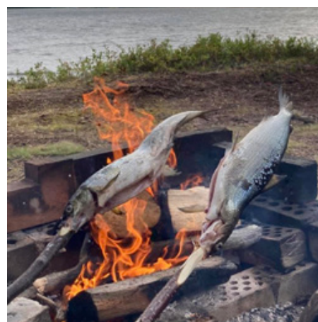
Kolttasaamelainen kalastuskulttuuri -hanke järjesti nuottausnäytöksen P. Trifonin pyhiinvaelluksen ja vedenpyhityksen yhteydessä 22.8.2020 koulun ja Kolttatalon rannassa Sevettijärvellä. Nuottaaminen kiinnosti kyläläisiä, vaikka kalansaalis jäikin kahteen kalaan. Siat paistettiin nuotiolla perinteisen tikkukalan tapaan ja jokaiselle riitti pieni maistainen saaliista.