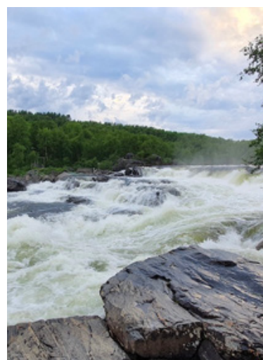
Kápäläverkkoa heitetään vain Norjan puolella Neidenissä Kolttakönkäällä, jossa kápälän heitto ja sillä otettavien saaliskalojen määrät ovat tarkkaan säädeltyjä.