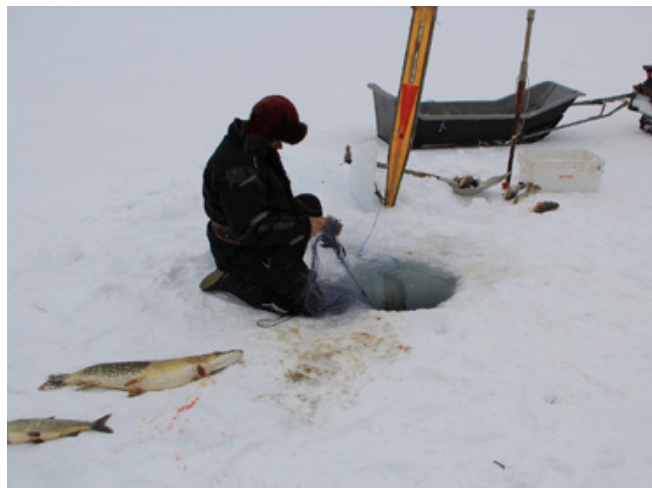
Moottorikelkkojen, perämootoreiden ja kalastusvälineiden kehitys ja yleistyminen ovat helpottaneet kalastusta merkittävästi ympäri vuoden.